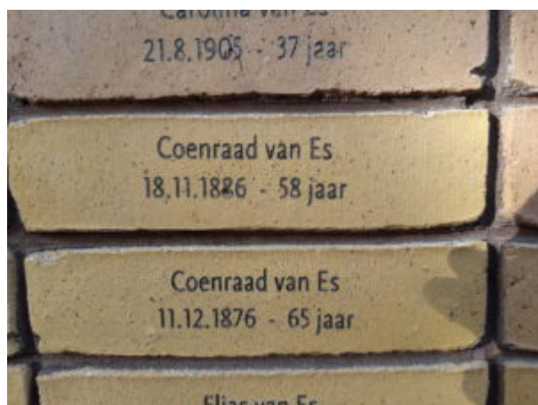
Ontwerp Holocaust Namenmonument

Niet alle Joden zijn vermoord in de gaskamers van vernietigingskampen zoals Auschwitz-Birkenau, Treblinka, Belzec, Majdanek, Chelmno en Sobibor. Velen zijn omgekomen door massa-executies, ziekte, honger, uitputting of het verrichten van slavenarbeid. Het Holocaust Namenmonument Nederland herdenkt al deze slachtoffers.