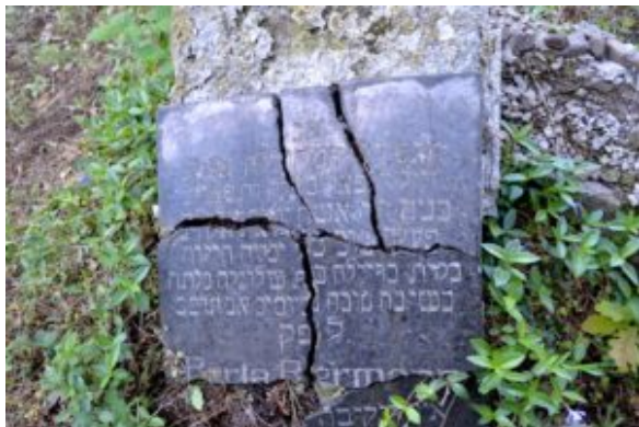
Grabstein der Familie Bermann auf dem jüdischen Friedhof in Kusel