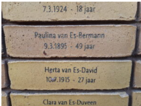
Holocaust Namenmonument Nederland

Ruim 102.000 slachtoffers van de Holocaust hebben na meer dan 75 jaar na de Tweede Wereldoorlog een eigen monument gekregen. In Amsterdam is een monument verrezen met alle namen van de Nederlandse Holocaustslachtoffers die geen graf hebben. Alle namen van Joden, Sinti en Roma die vanuit Nederland zijn vervolgd en gedeporteerd, alsmede gedeporteerde Nederlandse Joden woonachtig in andere landen, die in naziconcentratie- en vernietigingskampen zijn vermoord, alsook zij die zijn omgekomen door honger of uitputting tijdens transporten en dodenmarsen en waar geen graf van bekend is (lees ook: Welke namen komen er op het monument? ). Daarmee heeft Nederland eindelijk een tastbaar gedenkteken waar 102.000 Joden en 220 Sinti en Roma zowel individueel als collectief kunnen worden herdacht.