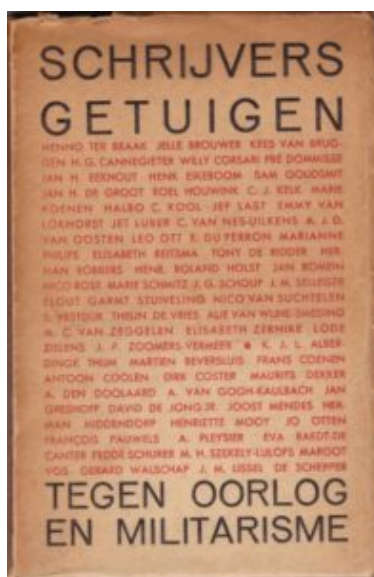
Uitgave Schrijvers getuigen tegen oorlog en militarisme