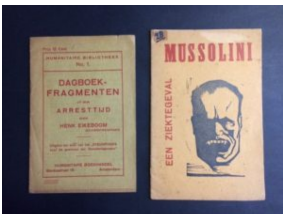
Brochures van Henk Eikeboom