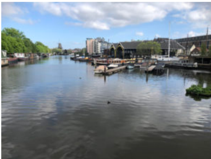
Doorkijk over de Nieuwe Vaart naar molen De Gooyer - Foto Neeria Oostram

De prachtige doorkijk over de Nieuwe Vaart naar Molen de Gooyer.