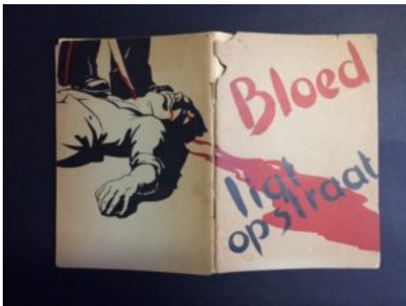
Poëziebundel van Henk Eikeboom

Een van de meest spraakmakende acties waaraan Eikeboom deelnam was de oprichting van de Rapaillepartij . Samen met de dadaïst Anthon Bakels en kunstenaar Erich Wichman richtte Eikeboom een politieke partij op, juist om aan te tonen dat het algemeen kiesrecht nergens toe leidt en om de opkomstplicht aan de kaak te stellen. Ook wilden ze de vraag aan de orde stellen of de massa in Nederland wel een juiste politieke keuze kon maken. Lijsttrekker werd de Amsterdamse zwerver Hadjememaar, die tot ieders verrassing in de Amsterdamse gemeenteraad werd gekozen. Na één raadsvergadering hief de partij zich op.