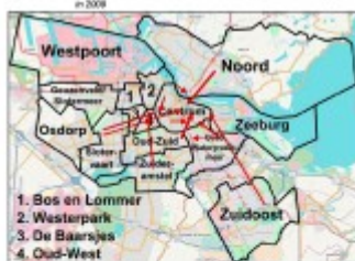
Figuur 4.1 Verspreiding woonbuurt naar favoriete coffeeshop (niet in eigen stadsdeel) in 2008

Coffeeshops in Westerpark zijn vooral in trek bij gebruikers uit dit (voormalige) stadsdeel en omliggende buurten. En coffeeshops in Oud-West trekken vooral respondenten uit dit voormalige stadsdeel en omliggende buurten.