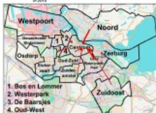
Figuur 4.2 Verspreiding woonbuurt naar favoriete coffeeshop (niet in eigen stadsdeel) in 2010

Coffeeshops in Westerpark zijn vooral in trek bij gebruikers uit dit (voormalige) stadsdeel en omliggende buurten. En coffeeshops in Oud-West trekken vooral respondenten uit dit voormalige stadsdeel en omliggende buurten.