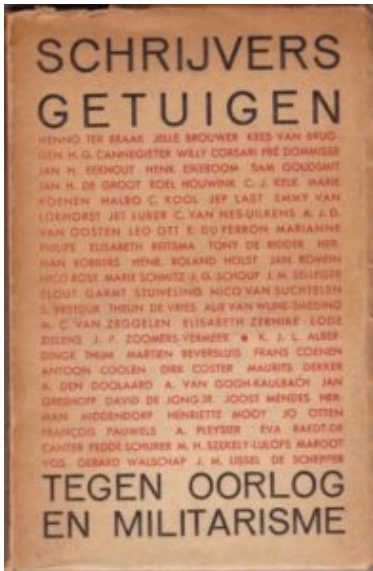
Uitgave Schrijvers getuigen tegen oorlog en militarisme