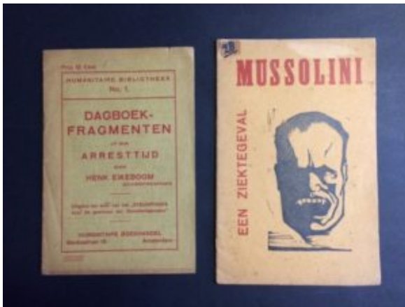
Brochures van Henk Eikeboom