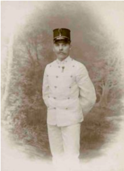
Kapitein Hans Christoffel.