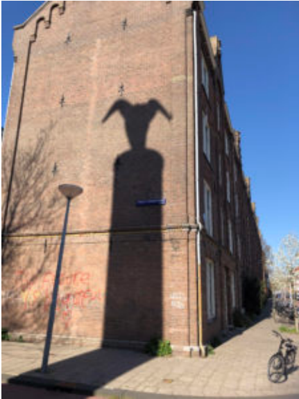
Tweede Coehoornstraat in de Czaar Peterbuurt

In Sporthal Oostenburg is het een kakofonie van kinderstemmen. Het is vakantie en de sporthal is omgebouwd tot een groot activiteitenparadijs. Kleine kinderen, sommige nog in de luier, rennen tussen jonge tieners door. Moeders, veel moeders, maar ook vaders en opa's en oma's kijken naar hun kinderen of op hun telefoon.