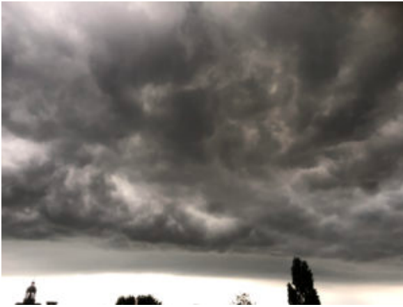
Torenpunt van de Oosterkerk