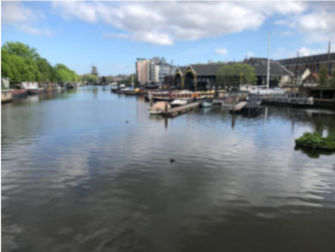
Doorkijk over de Nieuwe Vaart naar molen De Gooyer

Oosterkerk die als rustig bolwerk over Wittenburg uitkijkt. De boot gemaakt van autobanden in de Wittenburgervaart. Het Kattenburgerplein waar de buurt haar anker uitgooit. De oude pakhuizen met hun statige balkenscheefheid. Het winderige water van de Dijksgracht. Het Oostenburgerpark aan de voet van Pakhuis Oostenburg. De prachtige doorkijk over de Nieuwe Vaart naar Molen de Gooyer.