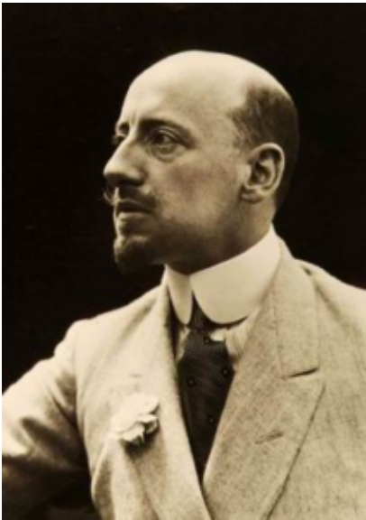
Gabriele D'Annunzio. 1863 - 1938.

parallellen tussen d'Annunzio en Boudewijn Büch voor de hand. Ook Büch dankte zijn bekendheid bij een groot publiek aan de verfilming van een boek waarin een kind overlijdt ( De kleine blonde dood , 1985), ook hij vulde zijn huis, naast kostbare eerste drukken van haast onvindbare boeken, met opgezette dodo's en kunst van uiteenlopende aard, en ook voor hem was de werkelijkheid ondergeschikt aan zijn fantasie.