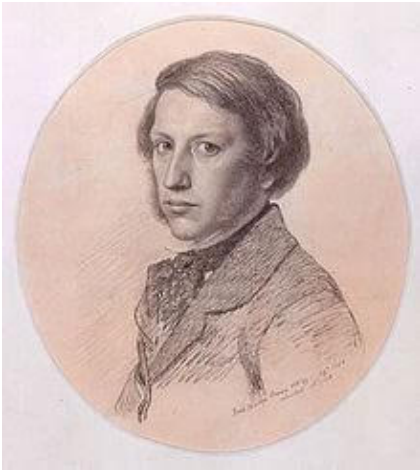
Ford Madox Ford