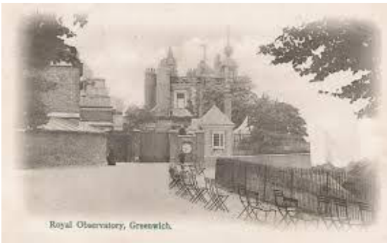
Greenwich Royal Observatory

De Pools-Engelse schrijver Joseph Conrad (1857-1924), auteur van onder meer Heart of Darkness en Lord Jim , liet zich voor zijn roman The Secret Agent (1907) inspireren door een ware gebeurtenis: een poging tot een bomaanslag op het Greenwich Royal Observatory in 1894. De gebeurtenis was niet meer tot dan de aanleiding voor de roman, stelde Conrad. Van de achtergronden ervan zou hij niet op de hoogte zijn geweest. Maar was dat wel zo? Wat waren dan deze achtergronden?