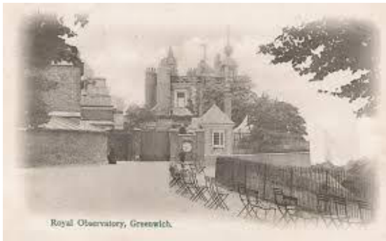
Greenwich Royal Observatory

De Pools-Engelse schrijver Joseph Conrad (1857-1924), auteur van onder meer Heart of Darkness en Lord Jim , liet zich voor zijn roman The Secret Agent (1907) inspireren door een ware gebeurtenis: een poging tot een bomaanslag op het Greenwich Royal Observatory in 1894. De gebeurtenis was niet meer tot dan de aanleiding voor de roman, stelde Conrad. Van de achtergronden ervan zou hij niet op de hoogte zijn geweest. Maar was dat wel zo? Wat waren dan deze achtergronden?