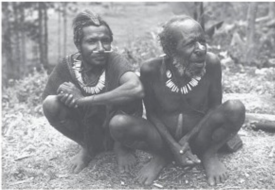
Pimen en oudere Sibiller met kettingen van varkenstanden

vertellen me over hun belevenissen in het Asmatgebied, waar ze op heel wat meters film enige interessante ceremonies hebben vastgelegd.