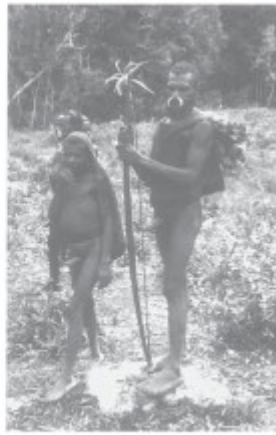
Alleen hun kostbare mbung-bogen mogen zij behouden

In het algemeen kan worden opgemerkt dat de expeditie nog altijd probeert op gang te komen. Oorzaak van de vertraging is hoofdzakelijk de vrij slordig geplande opvoer van de zo onmisbare voedselvoorraden en wetenschappelijke uitrusting. Voor begin april waren nog geen expeditiegoederen opgevoerd. De eerste weken van april en mei werd in totaal ca. 10 ton ingevlogen per Twin