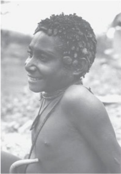
Sibiller met plakjes klei in het haar

bent ingeklommen rits je het muskietengaas dicht en lig je droog en beschermd tegen het welig tierende ongedierte. Het enige probleem kan zich 's nachts voordoen als bij het omdraaien, vooral na een jampotjesritueel bij mijn Franse vrienden, ook de hangmat een slag draait. Dat maakt het opstaan niet eenvoudiger. Zo'n situatie is nog beroerder als je, niet al te vroeg in de morgen, daartoe verwoede pogingen onderneemt als de Papoea's, die voor een afspraak bij het Bestuurskantoor in de rij staan, jouw geworstel meewarig gadeslaan.