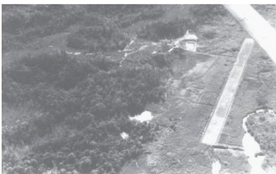
Luchtfoto van het basiskamp en vliegveld

Het valt me op dat er de laatste dagen meer vrouwen in de buurt van het kamp rondlopen dan de meisjes die regelmatig tegen een kleine beloning of een beetje rijst de grond rond de bivaks vrij van onkruid houden. Als ik rond etenstijd langs de keuken loop en een politieman als een soort gaarkeukenhouder met gulle hand rijst zie uitdelen, weet ik de reden van deze drukte. De vrouwen worden naar huis gestuurd, waarna politieman en koks op minder vriendelijke wijze te horen krijgen dat dit niet de bedoeling is. Als Bomdoge over dit voorval hoort, komt hij me namens de mannen vertellen dat het goed is dat ik af en toe eens tegen de vrouwen optreed. Als zij bij ons eten laten ze hun mannen maar verhongeren.