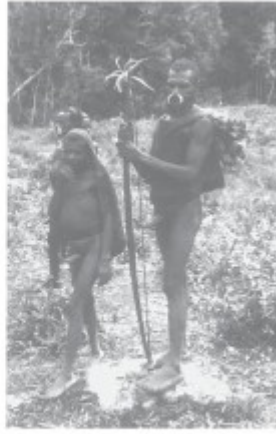
Alleen hun kostbare mbung-bogen mogen zij behouden

In het algemeen kan worden opgemerkt dat de expeditie nog altijd probeert op gang te komen. Oorzaak van de vertraging is hoofdzakelijk de vrij slordig geplande opvoer van de zo onmisbare voedselvoorraden en wetenschappelijke uitrusting. Voor begin april waren nog geen expeditiegoederen opgevoerd. De eerste weken van april en mei werd in totaal ca. 10 ton ingevlogen per Twin