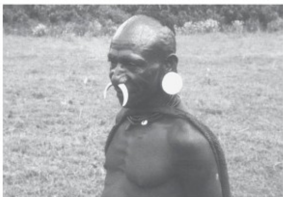
Sibiller met varkensslagtanden door