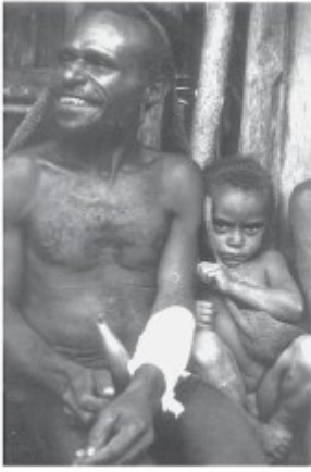
Gewunde krijger verbonden