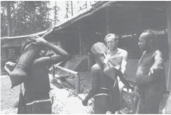
Sibillers met kleiknotten en kettingen van hondentanden

Evenals in het Mujugebied komt het huwelijk meestal tot stand door uitwisseling van de bruidsprijs. In geval van een schaakhuwelijk wordt de bruidsprijs verhoogd om de huwelijksluiting achteraf te legaliseren. Soms vindt er een roofhuwelijk plaats. Zo doodde Kagawera van Kigonmedip tijdens een oorlog een man en nam vervolgens de vrouw van het slachtoffer mee naar huis, evenals haar kinderen die later werden geadopteerd. Het zoontje van het slachtoffer Jangam uit het gebied van de Ok Bon, werd naar zijn vader genoemd en door Kagawera als natuurlijk kind beschouwd. Bruidsprijzen kunnen in gedeelten worden betaald. De Sibillers die regelmatig voor het bestuur werken kunnen de bruidsprijs direct betalen met de ijzeren bijlen en andere goederen die ze hebben verdiend. Deze goederen zijn zozeer in trek dat bewoners uit de noordelijker gelegen Kiwirok hun vrouwen wat graag aan Sibillers komen uithuwelijken. Drie ijzeren bijlen en drie parangs zijn meestal voldoende voor een bruidsprijs. De hoogte van de bruidsprijzen varieert echter per regio. Binnen de vallei zijn ze het hoogst.