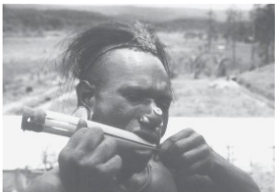
Sibiller met mondharp

Als een getrouwde man sterft en de weduwe nog jong genoeg is, dan zal een broer van de overledene de vrouw overnemen.