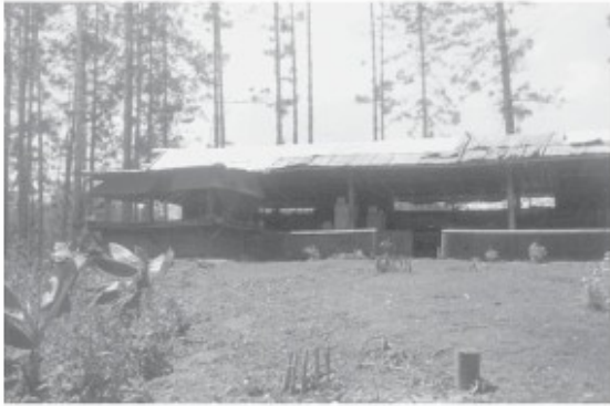
Het bivak op Mabelabol

landingsbaan veranderd. Hermans is terecht trots op dit resultaat en iedere morgen doet hij handenwrijvend zijn ronde over het veld om te zien hoe hoog het ingezaaide gras al is opgekomen. De afbakening van het veld, 1260 meter prachtig bloeiende afrikaantjes, is volgens de piloten ook vanuit de lucht een plaatje.