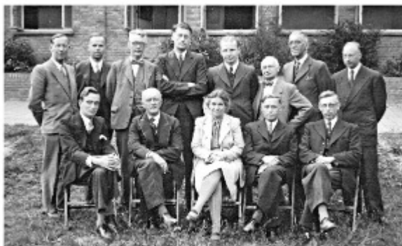
Docentes Murmellius Gymnasium, Alkmaar