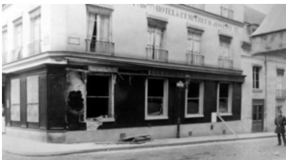
Hôtel Foyot na de aanslag

Fénéon, die vond dat zijn eigen schriftelijke bijdragen aan het verkondigen van de anarchistische boodschap niet voldoende effect hadden, nam zich voor de vertegenwoordigers van de bourgeoisie in het hart te treffen. Op 4 april 1894 verstopte hij een bom in een bloempot en toog ermee naar de zetel van de Franse senaat, gevestigd in het paleis in de Jardin du Luxembourg. Daar bleek hij echter niet in de buurt van het bewaakte gebouw te kunnen komen, waarop hij besloot de bom te plaatsen bij het tegenover gelegen Hôtel Foyot, een door veel parlementariërs bezochte eetgelegenheden. Hij plaatste de bloempot in de vensterbank van het restaurant, stak de lont aan en wandelde rustig naar de Place de l'Odéon, waar hij op de bus richting Clichy sprong. Door de ontploffing sneuvelden ramen en stortten kroonluchters van het plafond omlaag. Alleen de dichter Tailharde raakte gewond, het kostte hem een oog.