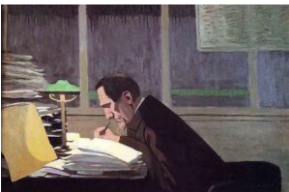
Vallotton - Félix Fénéon

Het was vooral sneu omdat Tailhade Fénéon persoonlijk kende en ook diens anarchistische opvattingen deelde. Zijn verwondingen weerhielden Tailhade er echter niet van in de jaren daarna in zijn werk het anarchisme volop uit te dragen.