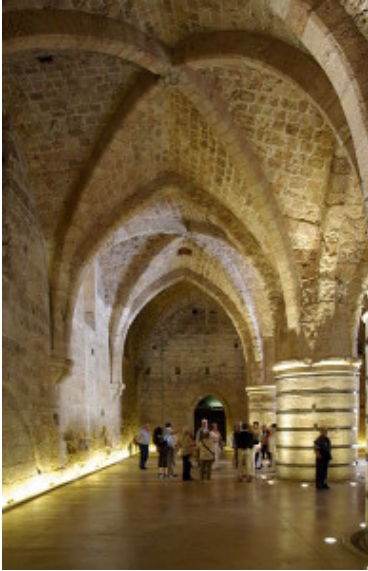
Kruisvaarders hospitaal Akko

Europa bevolkten de nauwe straatjes, bouwden ziekenhuizen, winkels en kazernes alsmede hospiesen voor de toenemende schare pelgrims die na de verovering van Jeruzalem door Palestina trokken. Mede dankzij deze krachtige havenstad konden de kruisridders aan hun nieuwe staat bouwen: het koninkrijk Jeruzalem.