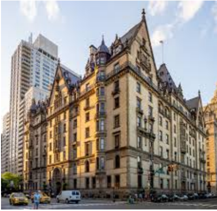
Dakota, New York

Maar bijnamen komen niet alleen voort uit een vorm. De Dakota , het appartementengebouw aan de westkant van Central Park, stond, toen het tussen 1880 en 1884 gebouwd werd, zó ver buiten de bewoonde wereld dat New Yorkers het gevoel hadden dat het in de staat Dakota, in het midwesten van America, gesitueerd leek. Het prachtige Woolworth Building , kantoorkolos van de Woolworth-keten (een soort Hema), kreeg het etiket the Cathedral of Commerce . Aan de oostkant van het park ligt the Museum Mile , het stuk Fifth Ave. met enkele van New Yorks belangrijkste musea: het Metropolitan , het Guggenheim en the Frick Collection . Aan dat deel van 5th Ave. huisden families als de Vanderbilts, de Astors en de Rockefellers.