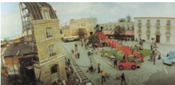
De set van Je vous présente Pamela in La Nuit américaine

Graham Greene en François Truffaut hebben gemeen dat ze allebei filmcriticus zijn geweest. Truffaut schreef voordat hij ging regisseren besprekingen voor het Franse tijdschrift Le Cahier du Cinéma . Zijn debuutfilm Les quatre cents coups (1959) sloeg destijds in als een bom. Met regisseurs Jean-Luc Godard, Claude Chabrol, Eric Rohmer, Agnès Varda en anderen, wordt hij gerekend tot de Nouvelle Vague. In de jaren vijftig en zestig weken deze filmers met hun werkwijze fundamenteel af van de tot dan toe heersende filmtradities. Hun aanpak was niet gebaseerd op van te voren geprogrammeerde scènes en dicht getimmerde scenario's, maar ging uit van experiment en improvisatie tijdens de opnames, in camerawerk, chronologie, editing en soundtrack.