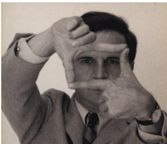
François Truffaut (1932-1984)

Voor de Tweede Wereldoorlog was Greene enkele jaren filmcriticus voor de Engelse tijdschriften The Spectator en Night and Day . Hij was een groot liefhebber van hard-boiled detectieveromans en films, zoals het werk van auteurs als Dashiell Hammett en Raymond Chandler en de detectieveromans en verfilmingen van de boeken van Erle Stanley Gardner over de advocaat Perry Mason. Voor de films van Alfred Hitchcock kon hij echter geen enkele waardering opbrengen. Hij vond ze volstrekt onrealistisch en benoemde ze als 'een aaneenschakeling van kleine melodrama's.' De enige film van Hitchcock die hij het aanzien waard vond was Sabotage uit 1936, losjes gebaseerd op de roman The Secret Agent van Joseph Conrad.