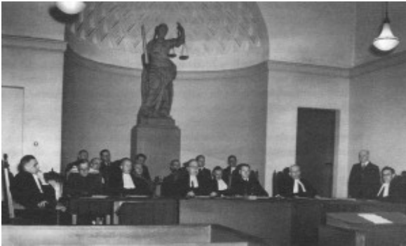
Foto van de bijzondere terechtzitting (inzake oorlogsmisdaden) in de Rechtbank te Utrecht op 9 december 1948. In de absis achter de rechters staat het beeld van Vrouwe Justitia.

Het spoor van Cressants Vrouwe Justitia daarentegen kunnen wij zonder moeite verder volgen in de tijd.