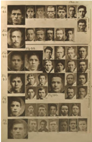
4. Francis Galton, composietfoto, 19de eeuw

elkaar geplaatste beelden zoals in het werk van Khan. Deze vraag zal beantwoord worden aan de hand van de kenmerken van fotografie die dit resultaat mogelijk maken en enkele voorbeelden uit de geschiedenis van de fotografie.