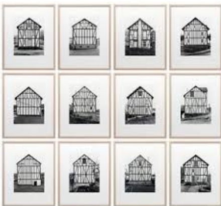
2. Bernd and Hilla Becher Fachwerkhäuser des Siegener Industriegebiet,