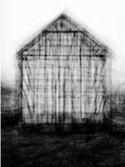
1. Idris Khan, every... Bernd and Hilla Becher Gable Sided House, 2004, foto, 203 x 165 cm.

De tentoonstelling Idris Khan every ... , die in februari 2008 te zien was in de Kunstsammlung Nordrhein-Westfalen in Düsseldorf, toonde enkele opmerkelijke toepassingen van herhalingen in de fotografische werken van de Engelse kunstenaar Idris Khan (1978, Birmingham). Hoewel deze kunstenaar steeds dezelfde techniek toepaste, waarbij beelden over elkaar heen werden gezet, voegde deze werkwijze elke keer andere betekenissen toe aan de gekozen onderwerpen. Khan koos voor zijn 'herhalingsprojecten' objecten die op de ene of andere wijze herhaling betreffen, bijvoorbeeld series foto's van een bepaald type gebouw of van fases van een handeling van een mens, of boeken over het thema herhaling. Centraal in deze bijdrage staat de vraag naar de gevolgen van Khans herhalingsstrategieën voor de betekenissen van het aspect herhaling in de gefotografeerde werken en in zijn daaruit voortgekomen fotografische werk.