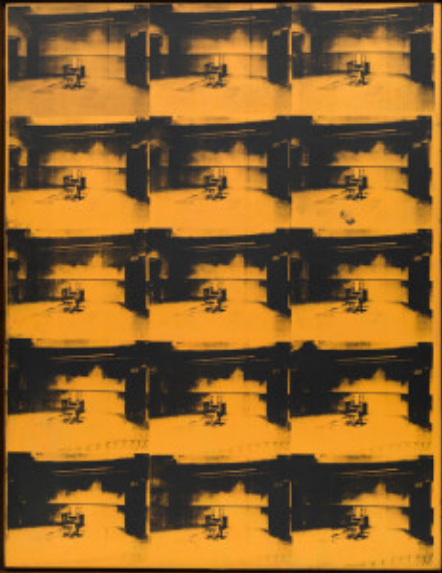
3. Andy Warhol, Orange Disaster , 1963, acrylverf op zeefdruk, 269 x 207 cm.

In zijn zeefdrukken bracht Warhol herhalingen van hetzelfde beeld in één werk samen, geordend in de vorm van een raster. Warhol gebruikte bijvoorbeeld voor Orange Disaster (1962) (afb. 3) een krantenfoto van een elektrische stoel. We zien hier dus niet een herhaling van een origineel – originele persfoto's blijven vrijwel altijd onzichtbaar – maar de herhaling van een kopie van de originele foto uit een krant. Deze krantenfoto was in een oplage van de krant al duizenden keren verschenen, wat mogelijk was geworden door de ontwikkeling van fotografische technieken en de grafische druktechnieken. Warhol zette dat reproductieproces voort door niet alleen de foto vijftien keer tot een soort tegeltableau te vermenigvuldigen, maar dit werk ook nog eens in oplage te produceren, als reeks (gedeeltelijk overschilderde) zeefdrukken, in plaats van als unica zoals schilderijen of tekeningen.