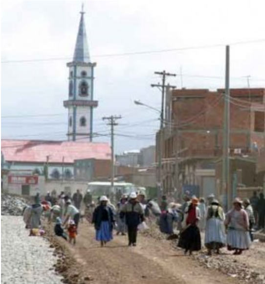
El Alto 2006

Op 21 januari 2010 werd Evo Morales Aima voor de tweede maal geïnaugureerd als president van Bolivia. Precies vier jaar eerder, op 21 januari 2006 accepteerde Evo Morales, de eerste inheemse president van Bolivia, al een keer zijn ' inheemse autoriteit ' tijdens een kleurrijke ceremonie in Tiwanaku, een indrukwekkende archeologische plaats ongeveer 70 kilometer van La Paz, de (informele) hoofdstad van Bolivia. Getooid in de traditionele kledij van een inheemse mallku - 'condor' of inheemse leider - werd hij toegejuicht door duizenden aanhangers die zwaaiden met de wiphala , de kleurrijke vlag die - hoewel dit ook betwist wordt - symbool staat voor alle inheemse volkeren van Zuid-Amerika. Vervolgens werd de president op 22 januari 's ochtends beëdigd in het parlement door het omhangen van de presidentiële sjerp en het afleggen van de gelofte om de grondwet te respecteren. Rechterlijke en militaire prominenten, een aantal belangrijke buitenlandse politici en de nieuw verkozen leden van het parlement waren aanwezig.