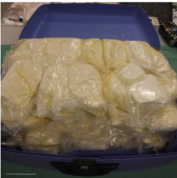
Amfetaminevangst 2009

Hoewel speed gewoon speed blijft, verschilde bij de gabbers de symbolische betekenis en context van het gebruik met die van de krakers en punks van de tweede amfetaminegolf. De brede popularisering van house en ecstasy had ertoe bijgedragen dat drugsgebruik niet meer automatisch werd beschouwd als de opruiende vrijetijdsverpozing van de subversieve jongeren- en straatculturen uit de jaren tachtig. Door het massale karakter van de dancecultuur in de jaren negentig werden drugsgebruikers veel minder als outlaws gezien, maar als consumenten die drugs gebruikten tijdens het stappen. Toch was de ruige gabbercultuur niet bepaald geknipt voor het gestileerde clubcircuit. Met uitzondering van de beginjaren negentig was er geen enkele club die gabber wilde draaien.