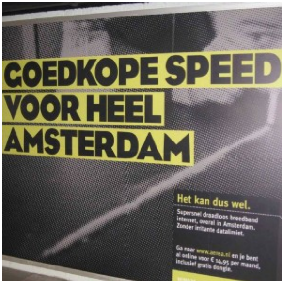
Metro Wibautstraat