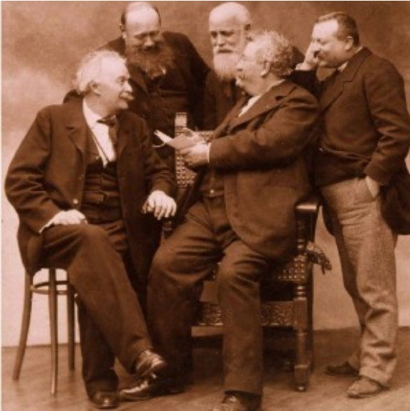
v.l.n.r. Nadar, Luminiere , Mariani, Sylvestre en Bonguinon

Erotische toespelingen op verleidelijke en 'nymfomane' vrouwen ('white lady', 'dame blanche', 'dama blanca') waren niet van de lucht. Ook toen al verschenen in de media breed uitgesponnen verhalen over wilde promiscue cocaïnefeesten in artistieke én criminele milieus. Cocaïne als nachtmiddel, de dichotomie van dag en nacht als de klassieke metafoor voor goed en kwaad, komt in deze context subliem tot uitdrukking in The strange case of Dr. Jekyll and Mr. Hyde (1886) van Robert Louis Stevenson, dat naar verluidt in korte tijd onder invloed van cocaïne is geschreven (Plant, 1999). De boodschap in het boek is interessant in het perspectief van de vaak verfoeide verderfelijke van het verleidelijke nachtleven, omdat het de calvinistische vrees weerspiegelt dat het kwaad een duivelse kracht is die in ons allen schuilt en krachtig onderdrukt dient te worden (Wevers, 2003). De satanische en met kwaad omklede Mr. Hyde, die heimelijk toeslaat in de nacht, geldt ruim honderd jaar later nog steeds als een stereotypische metafoor voor drugsgebruik, criminaliteit en verdachte handelingen die het daglicht niet zouden kunnen verdragen.