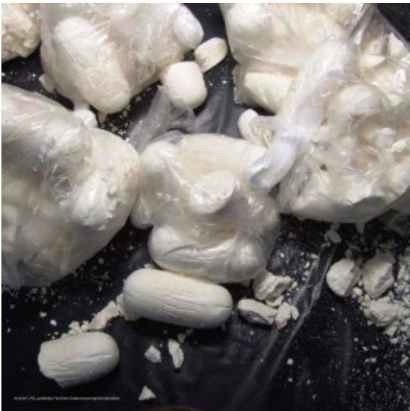
Archief LFO (Landelijke Faciliteit Ondersteuning Ontmantelen ~ Cocainebolletjes

Drugs verschijnen in allerlei varianten op de Amsterdamse markt. Sommige worden slechts mondjesmaat of gedurende een korte periode gebruikt (zoals bepaalde varianten van ecstasy en diverse psychedelische drugs), andere worden wel genomen, maar niet of nauwelijks door het uitgaanspubliek (vooral heroïne en basecoke of crack). Weer andere middelen worden wel door uitgaanders gebruikt, maar zelden of nooit tijdens het uitgaan (bijvoorbeeld paddo's).