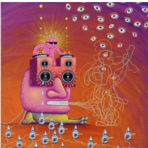
Illustratie Dadara • Brain DJ

Krul & Girbes (2009) komen - na langlopend Nederlands onderzoek tussen 1997 en 2006 - tot de conclusie dat een doorsnee houseparty veiliger is dan een voetbalwedstrijd. [x]