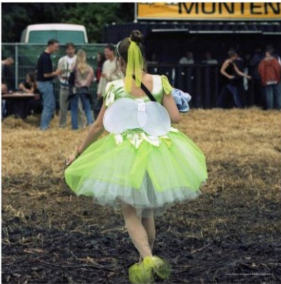
Amsterdamse Bos

jaren negentig, toen het drugsgebruik in het Amsterdamse nachtleven een absolute piek bereikte, nog 'screenagers'. De 'nieuwe nuchterheid' na de eeuwwisseling werd door deze 'stille generatie' geïnitieerd en beïnvloed. Ze oogt ingetogen en straalt meer 'coolness' uit. Ze geniet van nieuwe technologische gadgets en bling maar 'vergeet' te dansen. Dat was precies de kern van house twintig jaar geleden.