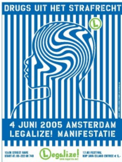
Ontwerp M-DSGN - Poster Legalize 2005

De roesbehoefte van de 'genotzuchtigen' staat vaak op gespannen voet met de heersende moraal van de 'genotschuwen'. Het rock-'n-roll virus - deels door amfetamine gevoed - gold ooit als revolutionaire katalysator voor het loslaten van verplichte figuren en sociale omgangsvormen binnen de danscultuur. Net als de 'seksuele wildheid' die jazz, jive en joints destijds in Amsterdamse dansgelegenheden teweegbracht, joeg rock-'n-roll het gezag de stuipen op het lijf. Tussen het 'rock around the clock' van de rockers en het 'go with the flow' van house ligt een periode van bijna veertig jaar. De magie van (nieuwe) ritmes is van alle tijden en de fascinatie voor deze toverkracht zal ongetwijfeld ook in de toekomst door nieuwe generaties worden gecultiveerd. "Alle bijzondere, nieuwe muziek groeit nog altijd tegen de verdrukking in. En dat is misschien maar goed ook. Dingen doen die verboden zijn, regels en wetten overtreden, tegendraads zijn: er is weinig waar een nieuwe generatie meer plezier aan beleeft" (Van Veen, 1994:9). Urenlang dansen op house kan zelfs leiden tot trance-ervaringen en tijdelijk zelfverlies ('extase') waarbij het individu wordt losgezongen van zijn persoonlijke begrenzing en spiritueel één wordt met zijn fysieke omgeving.