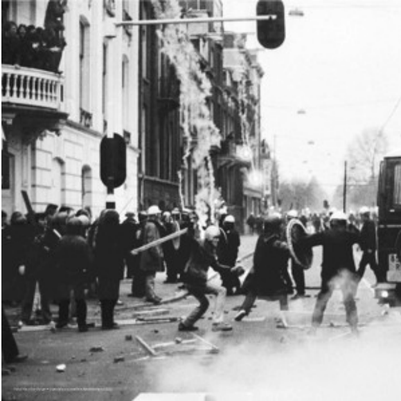
Vondelstraatrellen Amsterdam 1980