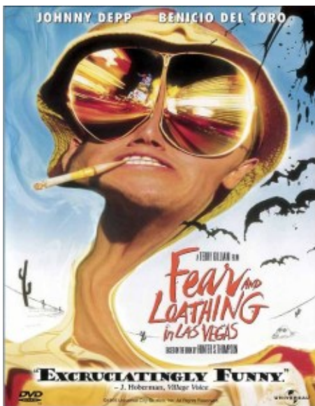
Illustratie Fear and loathing in Las Vegas

In de studie Outsiders (1963) van de Amerikaanse socioloog Howard Becker, worden andere invloedrijke sociaal-wetenschappelijke en criminologische theorieën over (subcultureel) drugsgebruik voor het voetlicht gebracht. Enerzijds werkt Becker de labelingtheorie uit, waarin de nadruk wordt gelegd op de gevolgen die strafbaarstellingen van bepaalde gedragingen voor de overtreeders hebben. Daarbij gaat Becker in op de processen die criminalisering, in het bijzonder in het geval van drugs, bewerkstelligen. Hij grijpt het criminaliseren van marihuanagebruikers door de Amerikaanse overheid aan om marihuanagebruik in het perspectief van de sociale leertheorie te plaatsen door de omschrijving van een praktijk die hij omschrijft als 'recreational use'.