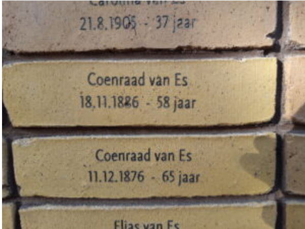
Ontwerp Holocaust Namenmonument

Het Nederlandse Auschwitz Comité heeft samen met de Pools-Joodse architect Daniel Libeskind op 16 december 2016 het nieuwe ontwerp voor het Holocaust Namenmonument Nederland gepresenteerd. Dit nationale monument is - meer dan 70 jaar na afloop van de Tweede Wereldoorlog - gerealiseerd in het hart van het Joods Kwartier in Amsterdam, daar waar het zich heeft afgespeeld.