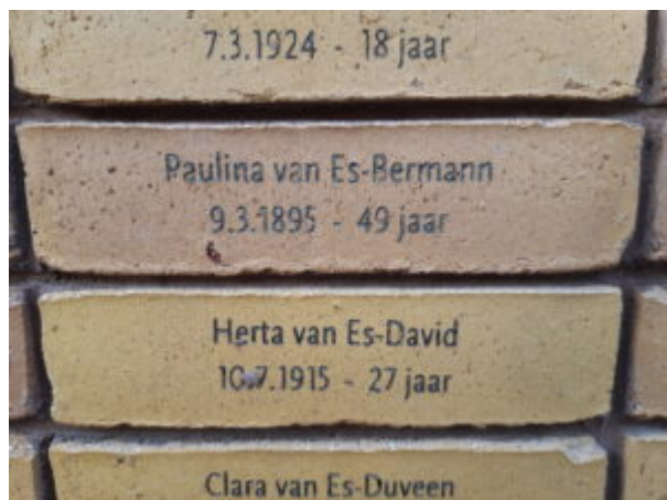
Holocaust Namenmonument Nederland

Ruim 102.000 slachtoffers van de Holocaust hebben na meer dan 75 jaar na de Tweede Wereldoorlog een eigen monument gekregen. In Amsterdam is een monument verrezen met alle namen van de Nederlandse Holocaustslachtoffers die geen graf hebben. Alle namen van Joden, Sinti en Roma die vanuit Nederland zijn vervolgd en gedeporteerd, alsmede gedeporteerde Nederlandse Joden woonachtig in andere landen, die in naziconcentratie- en vernietigingskampen zijn vermoord, alsook zij die zijn omgekomen door honger of uitputting tijdens transporten en dodenmarsen en waar geen graf van bekend is (lees ook: Welke namen komen er op het monument? ). Daarmee heeft Nederland eindelijk een tastbaar gedenkteken waar 102.000 Joden en 220 Sinti en Roma zowel individueel als collectief kunnen worden herdacht.