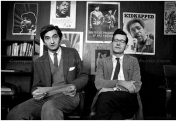
Howard Zinn en Noam Chomsky