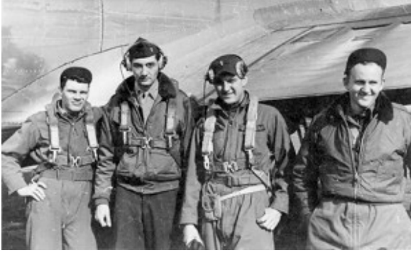
Zinn met collega's, Engeland 1945