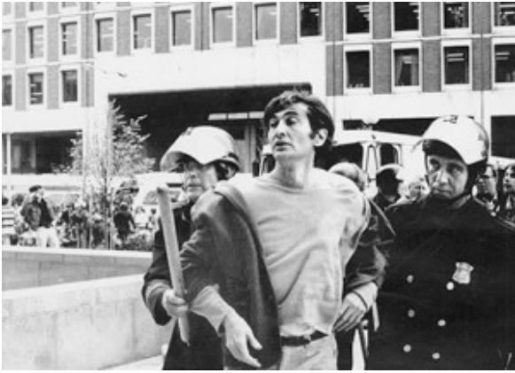
Arrestatie van Zinn in Boston 1971

Na de oorlog bezocht hij Royan een aantal malen en deed er onderzoek naar de gevolgen van de bombardementen. Hij toonde aan dat deze strategisch van geen enkel nut waren geweest en dat de militaire autoriteiten hadden gelogen over het aantal burgerslachtoffers. De resultaten van zijn onderzoek publiceerde hij in The Politics of History (1970). Hierin bekritiseert hij scherp de geallieerde bombardementen op Dresden, Hamburg en Tokio tijdens de Tweede Wereldoorlog, waarbij vooral burgerslachtoffers vielen, en het werpen van de atombommen op Hiroshima en Nagasaki. Meerdere malen veroordeelde hij de nutteloze bombardementen van de VS op Bagdad tijdens de inval in Irak en de acties in Afghanistan waarbij honderden burgers het leven lieten, net als tijdens de Tweede Wereldoorlog door de VS vergoelijkt met termen als 'collateral damage' en 'accidental'.