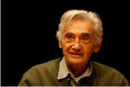
Howard Zinn

In het voorjaar van 1971 bereikten in de Verenigde Staten de protesten tegen de oorlog in Vietnam een hoogtepunt. Ruim zestig procent van de Amerikanen was tegen de oorlog, Washington werd bijna wekelijks overspoeld door massale demonstraties. Zo'n duizend Vietnamveteranen gooiden hun medailles over het hek bij het Capitool. Tijdens een van de demonstraties legden zo'n twintigduizend deelnemers het verkeer in Washington plat.