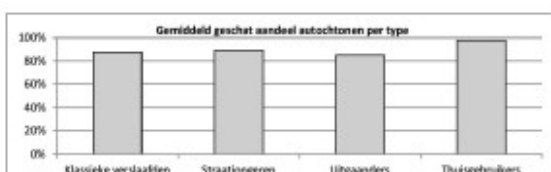
Gemiddeld geschat aandeel autochtonen per type