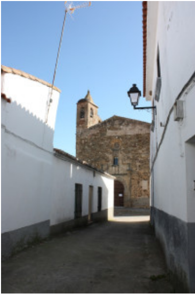
Iglesia de Santa Catalina de Monroy desde XIV siglo Santa Catalina Church from XIV century