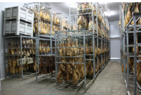
Hermanos Galea - fábrica de