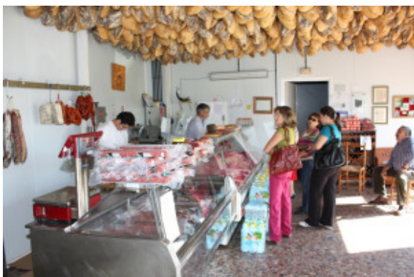
Tienda de la fábrica Shop at the factory

embutidos y jamones Factory of sausages and hams