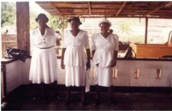
Gereed voor rouwvisite

die soms bijzonder emotioneel kunnen zijn. De bijeenkomst kent uiteenlopende sociale, religieus-spirituele, psychologische en financiële dimensies en verplichtingen. Symbolisch gezien stappen betrokkenen tijdens of door dit samenzijn uit het daglicht ( da dei kaba , de dag is voorbij) het nachtelijk duister in ( da neti kon , de nacht is gekomen), waaraan een van de vele dede oso-singi (letterlijk sterfhuisliederen) refereert. Pas hierna kan (en moet) een nieuwe dag tegemoet getreden worden.