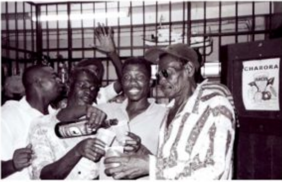
Afbeelding 10: Dragiman bij 'Kasje' (Foto: Yvon van der Pijl)

Dragiman bij 'Kasje' (Foto: Yvon van der Pijl)