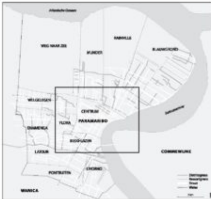
Kaart II ~ Paramaribo: ressorten