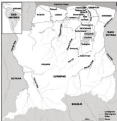
Kaart I - Suriname & districten