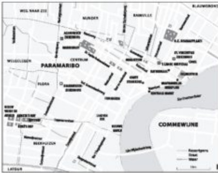
Kaart III ~ Paramaribo: centrum & aangrenzende ressorten

Paramaribo: centrum & aangrenzende ressorten