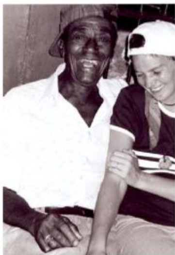
Afbeelding 27: In memoriam Oom Paul. 'Howsu!!! A so a de, a so a tan'

religieus-spirituele oriëntatie van de verteller in kwestie, oftewel zijn of haar wereld- of mensbeeld, de daarmee samenhangende onsterfelijkheidconstructies en het betekenissenweb waarin hij of zij zich geweven weet.