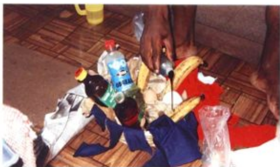
-afbeelding 24: Een baskita maken (Yvon van der Pijl)

en wat bezweringen of luid gevloek weggeslagen worden. In andere gevallen brengen nabestaanden een offer om een plek te reinigen of vrij te maken van slechte krachten. Pai pasi , 'de weg betalen', zegt men wel, of men zet een paiman (letterlijk schuld, winti -offer) om de weg schoon te maken. [viii] "Dus dan zetten we ergens op een hoek, ergens waar iets met iemand gebeurd is een baskita [mand] om die pai [schuld] te betalen", praatte een trouwe informant me bij over dit gebruik.