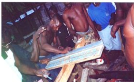
Afbeelding 22: Maken van een 'grafpaal' ter gelegenheid van Sursie's aitidei (Yvon van der Pijl)

Maken van een 'grafpaal' ter gelegenheid van Sursie's aitidei - Foto: Yvon van der Pijl