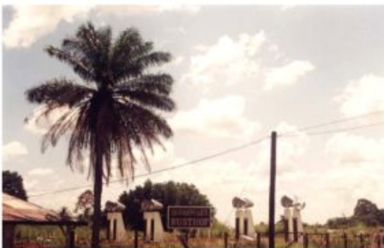
Afbeelding 7. Openbare begraafplaats Rusthof met monument ter herdenking van de vliegtuigramp bij Zanderij in 1989

Binnen deze ontwikkelingen kunnen we de opkomst, organisatie en institutionalisering van het lijkbewasserswerk plaatsen, het wasi dede of dinariwroko . Deze ‘organisaties van liefdewerk’ ontstonden als aparte verenigingen of als onderdeel van de reeds opgerichte (kerkelijke) begrafenisfondsen. Tegen betaling van een maandelijks bedrag konden leden zich zo verzekeren van deugdelijke zorg voor de overledene. De specifieke organisatiestructuur en subcultuur van de talloze afleggersverenigingen zullen in de volgende hoofdstukken nog verder aan bod komen. Alhier richten we ons vooral op het ‘kopen van de lijkpenning’, een wat vreemde uitdrukking, die slaat op de organisatorische en financiële rompslomp rondom lijkbezorging en uitvaart. Begrafenisfondsen en ondernemingen kunnen in deze beslommingen een belangrijke ondersteunende rol spelen, maar soms ook een extra zorg vormen in de rituele organisatie en calculaties.