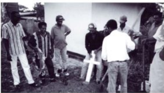
Afbeelding 27: Nolly ondrogron, rk-begraafplaats

Nolly ondrogron, rk-begraafplaats