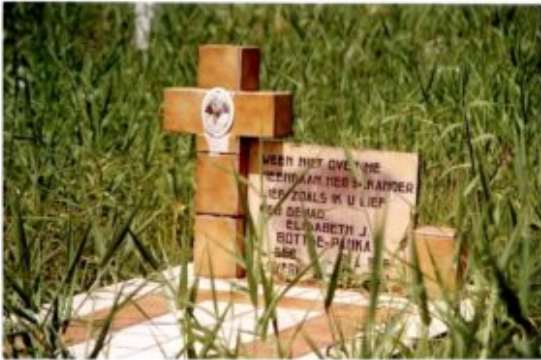
afbeelding 14 Individualisering van graven, 'kelder' op begraafplaats (Louis Noorlander)

ongewijde grond. De plek wordt wel aangeduid met lemkigron , omdat de graven van deze 'zondaars' zich onder de lemmetjesbomen (limoenbomen) bevonden. Ondanks de uitgestrektheid, maakt de dodenakker een chaotische indruk. De planten en het onkruid woekeren, zoals op bijna elke begraafplaats, overal langs en doorheen en vanwege ruimtegebrek is mengenoedzaakt geweest ook op de paden te begraven. Ofschoon er formeel geen klassenonderscheid meer wordt gemaakt, is deze wel degelijk te vinden.