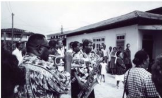
„Mwilingi 18: Bazuinkoor, rk-begraafplaats (Yvon van der Pijl)

De overledene wordt dan met het nodig ceremonieel, onder gewuif van palmtakken, de begraafplaats op gedragen richting de (eveneens versierde) aula. Daar wordt de kist op een centraal geplaatste baar gezet en openen de dragiman de kist. Veelal wordt het deksel op driekwart van de kist gelegd en wordt over een deel van de lijk-kist een rouwkleed van de dragers- of afleggersvereniging geplaatst. Het lichaam van de overledene wordt door de dragers of aanwezige dinari nog wat gefatsoeneerd en is dan goed zichtbaar opgebaard voor de aanwezigen die de gelegenheid krijgen om vóór of ná de dienst afscheid te nemen. Aan het hoofdeinde van de kist blijft een drager (of dinari ) vaak 'de wacht houden'.