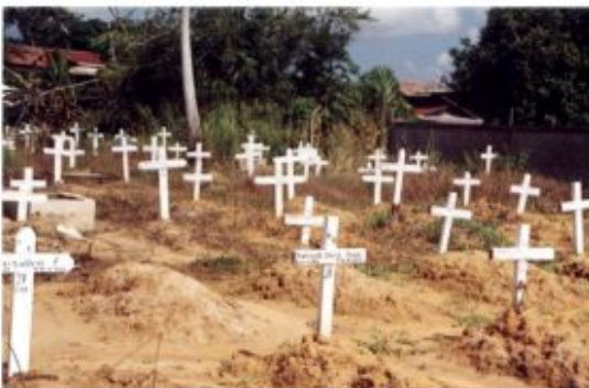
Afbeelding 16: 'Zandgraven' begraafplaats Mariusrust