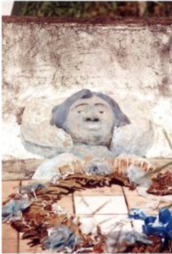
Abbildung 13. Individualisering van graven, de begraafplaats