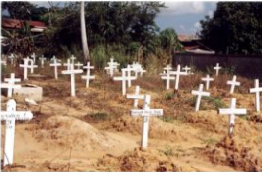
Afbeelding 16: 'Zandgraven' begraafplaats Mariusrust