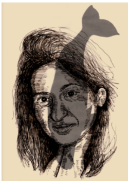
Minouche Shafik

‘Wij hebben een nieuw sociaal contract nodig dat beter in elkaar zit, dat zekerheid en kansen biedt voor iedereen. Een sociaal contract dat minder gaat over ‘mij’ en meer over ‘wij’, dat onze onderlinge afhankelijkheid onderkent en daar tot ons wederzijds profijt gebruik van maakt.’