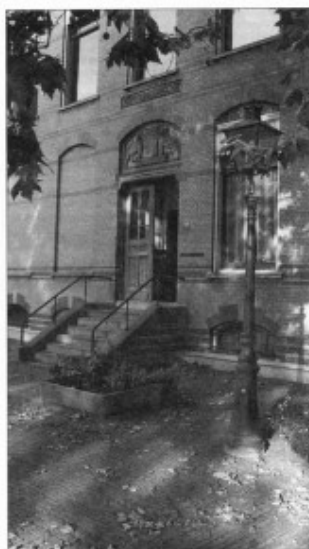
Voormalig kantongerecht, Hamburgerstraat

Het was de humanist Dirck Volckertsz. Coornhert, die aandrang op een betere behandeling van 'ledigen en quaetdoende rabbauwen'. Toen hij zelf in 1567 door Alva in de Gevangenpoort te 's-Gravenhage was opgesloten, werd hij zich in de eenzaamheid van zijn gevangenis bewust, dat lediggang inderdaad des duivels oorkussen is. Hij maakte daar een ontwerp van zijn geschrift Boeventucht , waarin hij er op aandrang de bedelaars en landlopers ' in besloten plaatsen op water en brood nutte [iii] Hantwercken te leeren '.