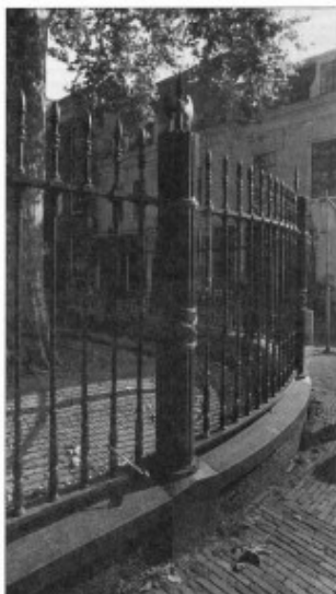
Hoek Hamburgerstraat - Korte Nieuwstraat

Het Franse wetboek van strafrecht, de Code Pénal , bleef in Nederland officieel van kracht tot 1886. In de tussentijd zijn er in ons strafrecht echter flinke wijzigingen aangebracht. In 1813, direct na zijn terugkeer uit ballingschap, vaardigde koning Willem I het beruchte gesel- en wurgbesluit uit dat tot 1854 de officiële richtlijn was. De 'Franse' dwangarbeid werd hierin vervangen door de schavotstraffen geselen en brandmerken en door opsluiting in een rasp- of tuchthuis. Na 1848 is er in Nederland niet meer publiekelijk gezeseld of gebrandmerkt. De doodstraf verdween in 1870 uit de strafrechtpraktijk, maar was al sinds 1860 niet meer voltrokken. Het vacuüm in het straffenarsenaal dat hierdoor ontstond, werd opgevuld door vrijheidsstraffen, al of niet met dwangarbeid of in eenzaamheid. De Franse filosoof Michel Foucault ziet in deze overgang een bewuste machtspolitiek van de staat die met steeds verfijndere manieren de ingezetenen trachtte (en nog steeds tracht) te disciplineren. Na eerst het lichaam (lijfstraffen) bewerkt te hebben, probeerde de overheid via langdurige vrijheidsstraffen ook de misdadige ziel in het gareel te krijgen. In het midden van de negentiende eeuw werden koepelgevangenis gebouwd. Iedere gevangene kreeg een aparte cel. Door de ronde vorm kon men vanuit één punt alles overzien en controleren [v]. Big brother was alom vertegenwoordigd.