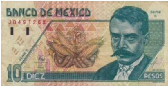
Bankbiljet met Zapata 1994