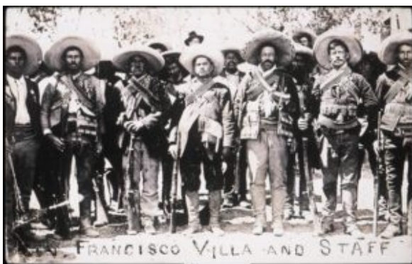
Derde van rechts: Pancho Villa

Madero benoemde de meedogenloze generaal Victoriano Huerta tot legerleider, om zo Zapata te kunnen bestrijden. Huerta liet Madero vervolgens uit de weg ruimen en benoemde zichzelf tot president. Het jaar 1914 werd gekenmerkt door een felle strijd tussen het federale leger en de opstandelingen. Het boerenleger van Zapata in Morelos en de troepen van Villa in het noorden, bestookten voortdurend het Mexicaanse leger. Aanvankelijk steunde Villa weliswaar Huerta, maar al snel keerde hij zich van hem af. Villa wilde in de eerste plaats de macht van de grootgrondbezitters doorbreken.