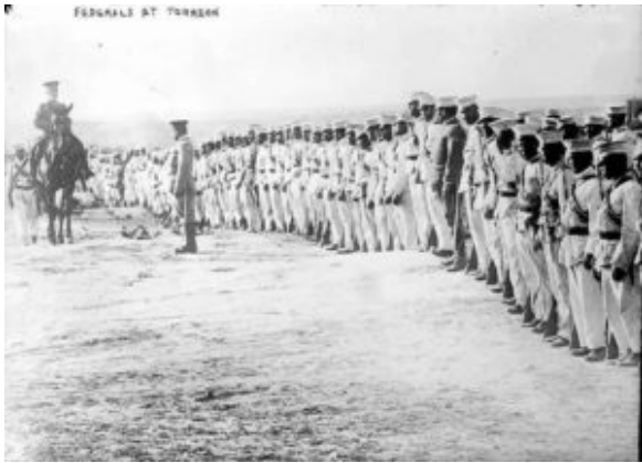
Generaal Huerta inspecteert zijn troepen