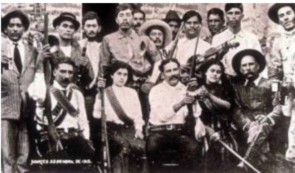
Aanhangers van Madero

landeigenaren, de hacendados . Deze eigenden zich land, waterbronnen en soms hele dorpen ( pueblos ) toe om hun suikerplantages te kunnen uitbreiden. De hacendados voelden zich gesteund door de Mexicaanse dictator Porfirio Díaz, die regeerde van 1876 tot 1911. De kleine landeigenaren en onafhankelijke boeren stonden volgens Díaz de vooruitgang van Mexico in de weg. Zapata wierp zich op als hun vertegenwoordiger en protesteerde voortdurend bij de lokale autoriteiten tegen de handelwijze van de hacendados. Dit had geen enkel resultaat. Zij zagen Zapata als een vervelend obstakel voor hun belangen. Om hem uit de streek weg te krijgen, wist men hem over te halen dienst te nemen in het leger. Daar viel hij op door zijn vakmanschap in de omgang met paarden. Na een half jaar hield hij het leger voor gezien en keerde hij terug naar zijn dorp waar hij als burgemeester werd gekozen. Al voor 1910 begon hij met medestanders stukken land die door de hacendados waren ingepikt, terug te veroveren.