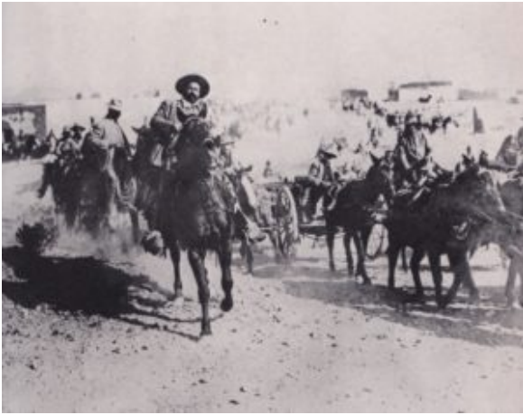
Pancho Villa voert zijn leger aan