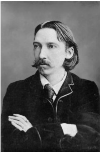
Robert Louis Stevenson (1850-1894)