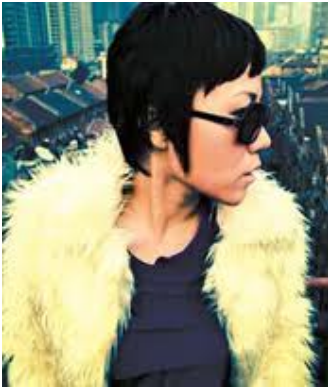
Mian Mian (1970-)