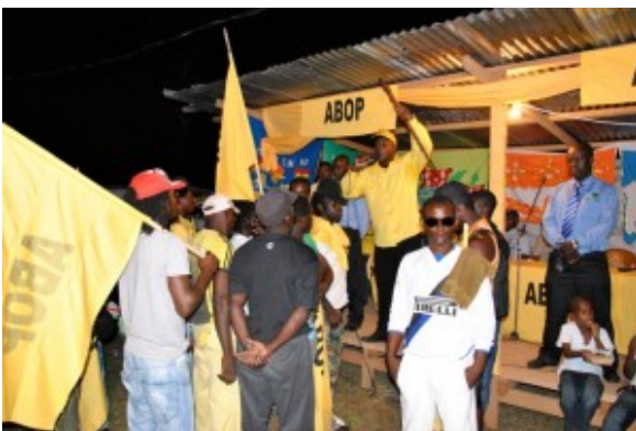
Brunswijk – verkiezingsbijeenkomst –

De aanduiding van Brunswijk als een Surinaamse, zwarte Robin Hood was in Nederlandse media in die eerste week na de overvallen op militaire posten in Oost-Suriname populairder dan de vergelijking met Boni. Vóór de overvallen op Stolkertsijver en Albina in de nacht van 21 op 22 juli waren Brunswijks acties al geïnterpreteerd als een 'guerrillastrijd' . In de Leeuwarder Courant van 27 mei 1986 – die zich baseerde op GPD- en ANP-berichten – werd Brunswijk aangeduid als een 'gedeserteerde' sergeant die sinds april een guerrilla-oorlog tegen het Bouterse-regime voerde. Het was de Raad voor de Bevrijding van Suriname van wie de informatie klaarblijkelijk afkomstig was. Het is twijfelachtig of de acties van Brunswijk op dat moment als zodanig geïnterpreteerd moeten worden. Was er niet eerder sprake van een 'wraakmotief' en deed niet pas later een politiek motief, herstel van de democratie, zijn intrede (Volker 1998:166)? In het interview dat ik met hem had zei Brunswijk letterlijk, dat het Surinaams verzet hem vroeg de democratie te helpen herstellen. Edwin Marshall, die ook betrokken was bij het Surinaams verzet, bevestigde tegenover mij: 'In 1985 begon Brunswijk hier en daar met overvalletjes; hij deelde geld uit. Er was toen nog geen sprake van een ideologische strijd (De Vries 2005:16, 20).'